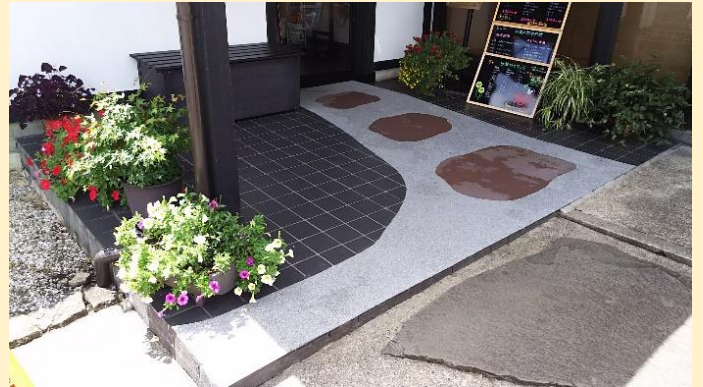
意匠アレンジしつつ、滑制加工できました！！