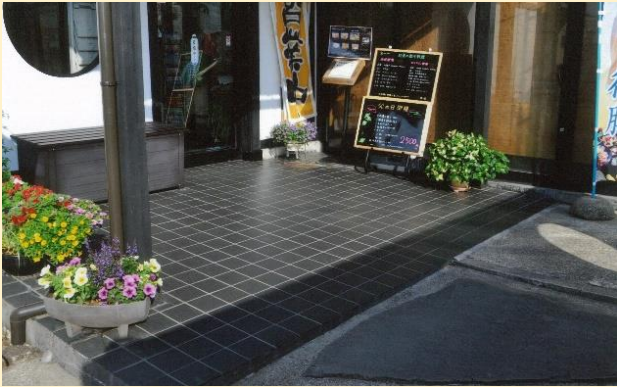
雨の日はよく滑っていた入口も・・・。

「サンドフリック」とは 様々な現場の「滑る」場所へ、特殊な「排水性滑制加工」を施し、半永久的に滑りを抑える新しい加工です。