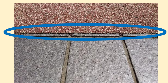
施工の厚みはわずか2mm

※転倒事故は損害賠償の問題につながりやすく、運営に支障をきたす事はもちろんですが、何よりも「転倒・滑落の際のケガが原因となり、その後の生活が不自由になられる方」をつくってしまいます・・・。